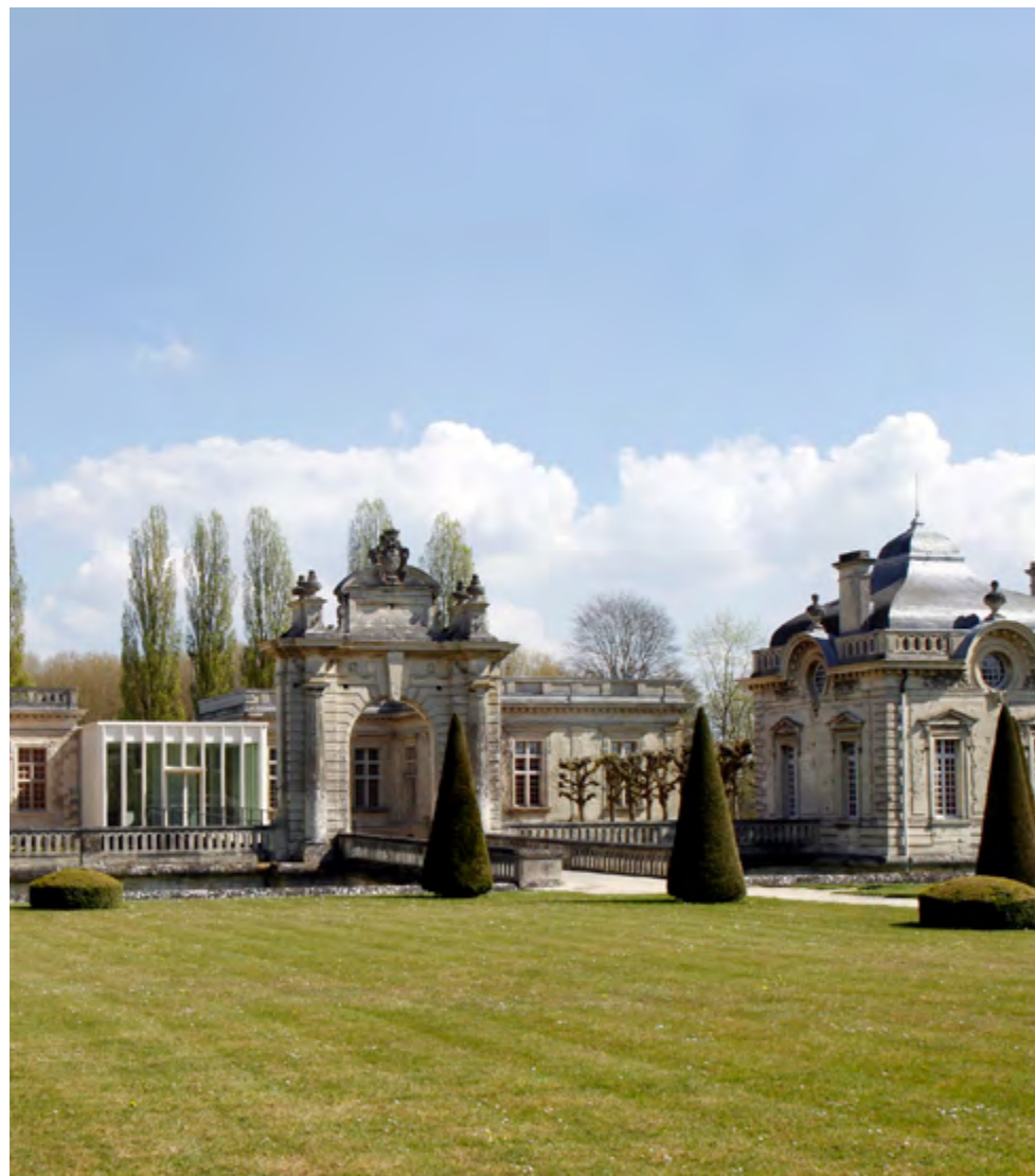
Musée franco-américain du Château de Blérancourt.

Ce musée a fait l'objet d'une importante rénovation et extension en 2017 qui permet de présenter les collections selon trois grande thématiques : les Idéaux des Lumières à l'origine des premières alliances entre les deux nations, les Épreuves pendant lesquelles la France et les Etats-Unis ont combattu côte à côte, et les Arts, sujet de nombreux échanges transatlantiques.