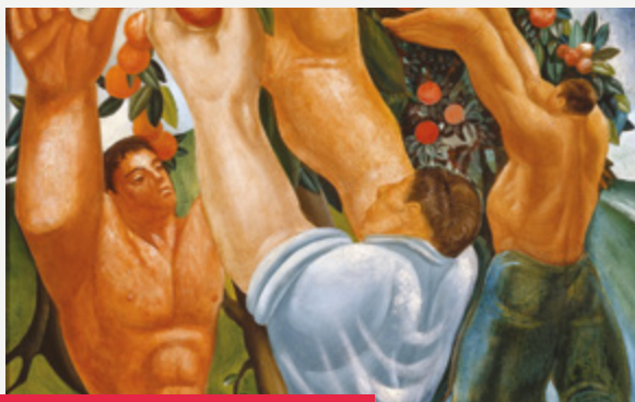
Arthur Ludov (X e siècle), The Orange Pickers (Les Ramasseurs d'oranges)