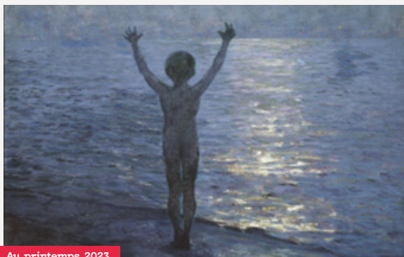
Thomas Alexander Harrison, L'Effort au bord de la mer

À l'euphorie de la victoire de 1918, succède en 1929 une crise sans précédent qui va plonger l'Amérique dans la Grande Dépression. Ces années noires, entre crise économique et crise agricole, trouvent un écho dans la peinture du temps. Aux thèmes légers et à la peinture claire de l'impressionnisme des années 1920, répond bientôt un réalisme social, aux lignes plus dures, aux coloris sombres et aux sujets répondant aux problèmes de société qui déchirent l'Amérique.