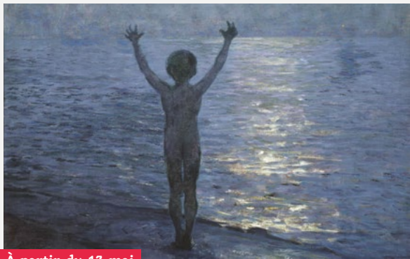
Thomas Alexander Hartigan, L'Indien en bord de la mer